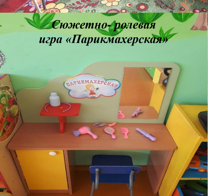
Сюжетно-ролевая игра «Парикмахерская»