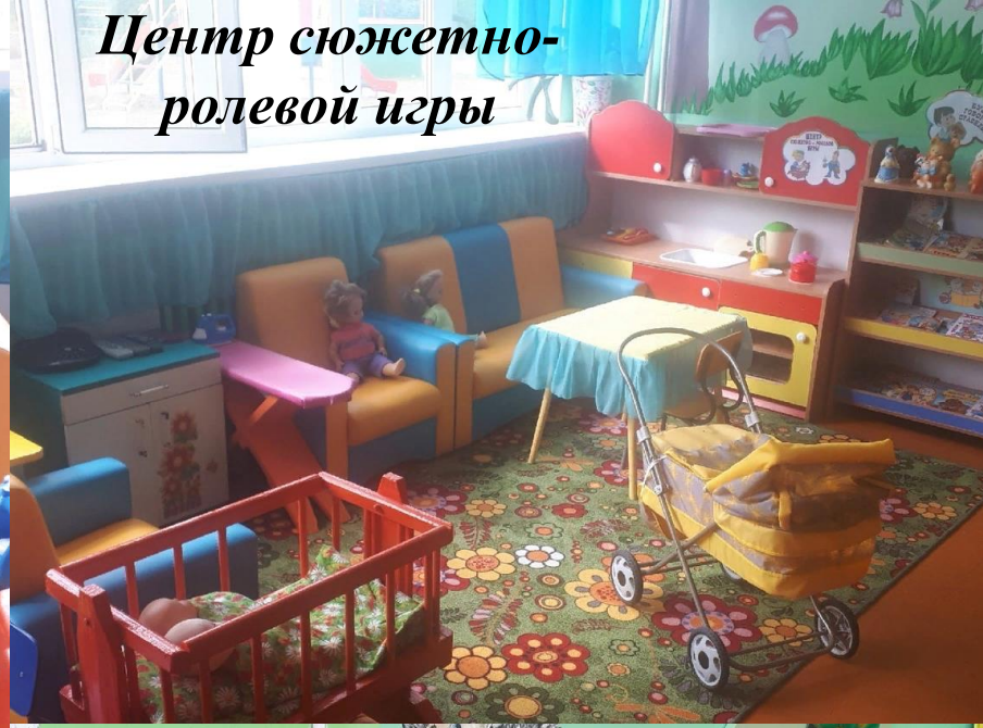
Центр сюжетно-ролевой игры