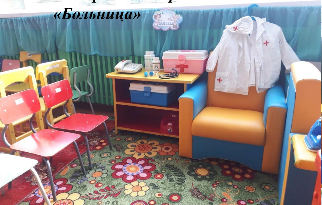
Сюжетно-ролевая игра «Больница»